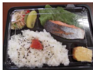
この日のメニューは鮭の塩焼き☆

デイケアでは、隣の福祉施設から、昼食の弁当を届けてもらっています。唐揚げやサバのみそ煮など、栄養も満点で美味しいですよ。